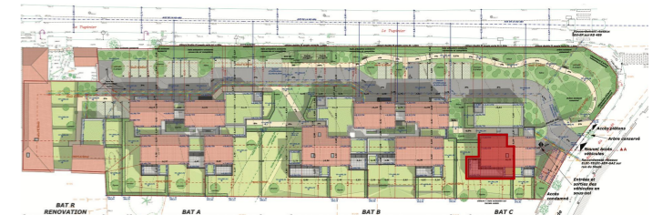
TABLEAU DES SURFACES ET ANNEXES

LOGEMENT N° : C 12 BATIMENT : C NIVEAU : R+1 TYPE : T5 Duplex